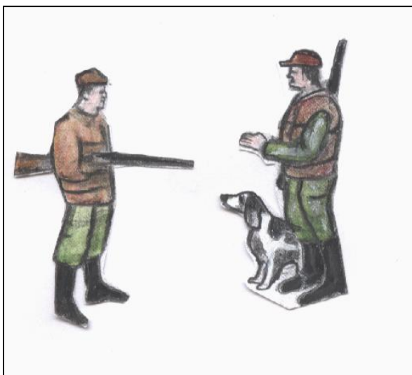
Εικ. 2.1 Κάθε σωστός κυνηγός τηρεί τις αρχές (Νόμους) και τους κανονισμούς του κυνηγιού και ευγενικά απαιτεί και από τους άλλους κυνηγούς να κάνουν το ίδιο.

Παραθέτουμε πιο κάτω τις έξι αρχές που πρέπει να αποτελούν μέρος του κανόνα ηθικής του κυνηγού και να εφαρμόζονται κατά γράμμα: